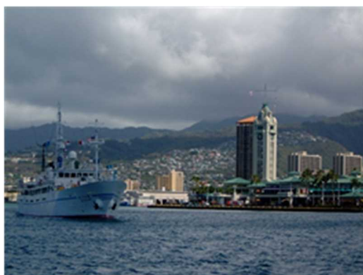
【ホノルル港を出航する新大分丸】

学校には水産高校特有の施設・設備等があるが、それら施設を地域に開放し、生徒が日頃身に付けた知識・技術を発揮することで学習の深化につながると考えている。地域も生徒の若い力を活用することで地域を活性化することにもなり、生徒の若い力で海洋教育の普及活動が進むと思われる。この活動を行うにあたって必要となることは、地域や産業界等との協力関係である。幸い本校は水産業や海洋関連産業など地域産業から大きな期待が寄せられている。