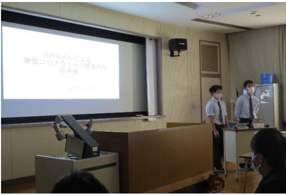
写真③（課題研究中間発表）