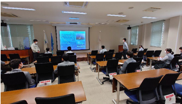
写真⑤（佐賀大連携事業）