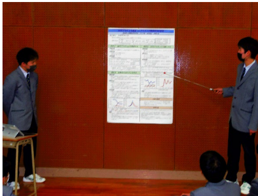
写真④（課題研究 最終発表）