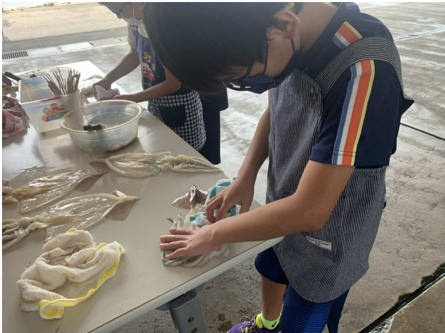
自分でイカをさばく