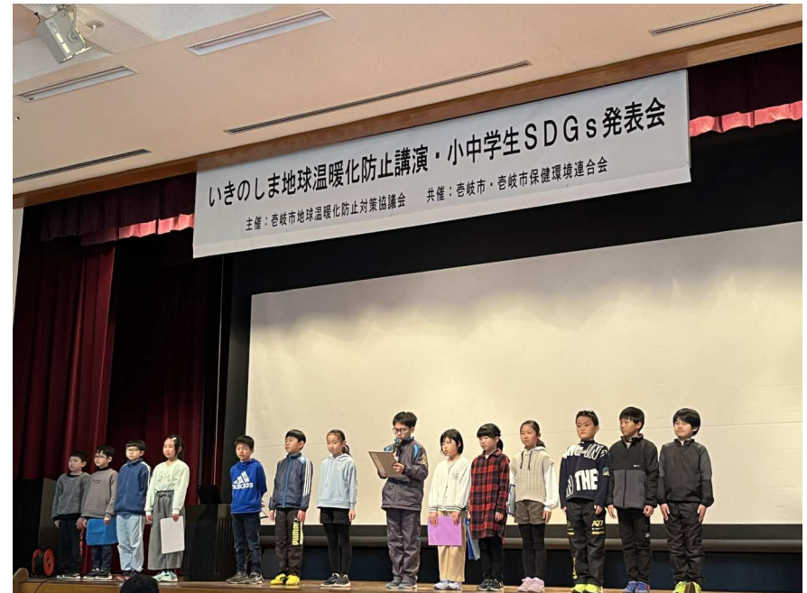
地球温暖化防止対策協議会発表会