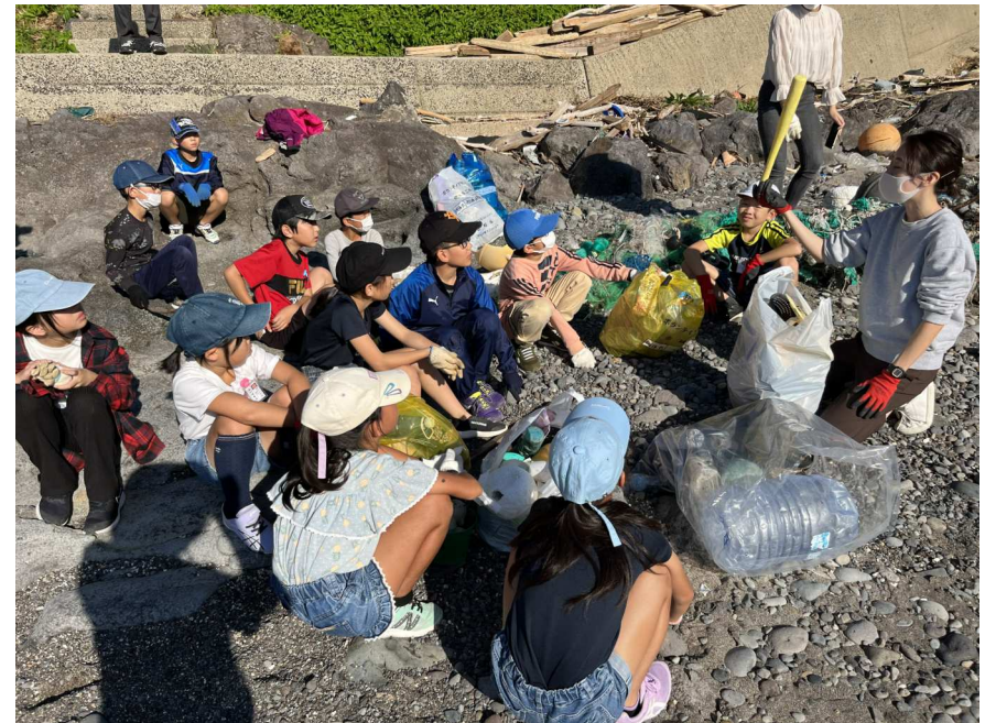
拾ったゴミについて対話