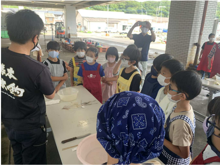
イカの体やさばき方説明