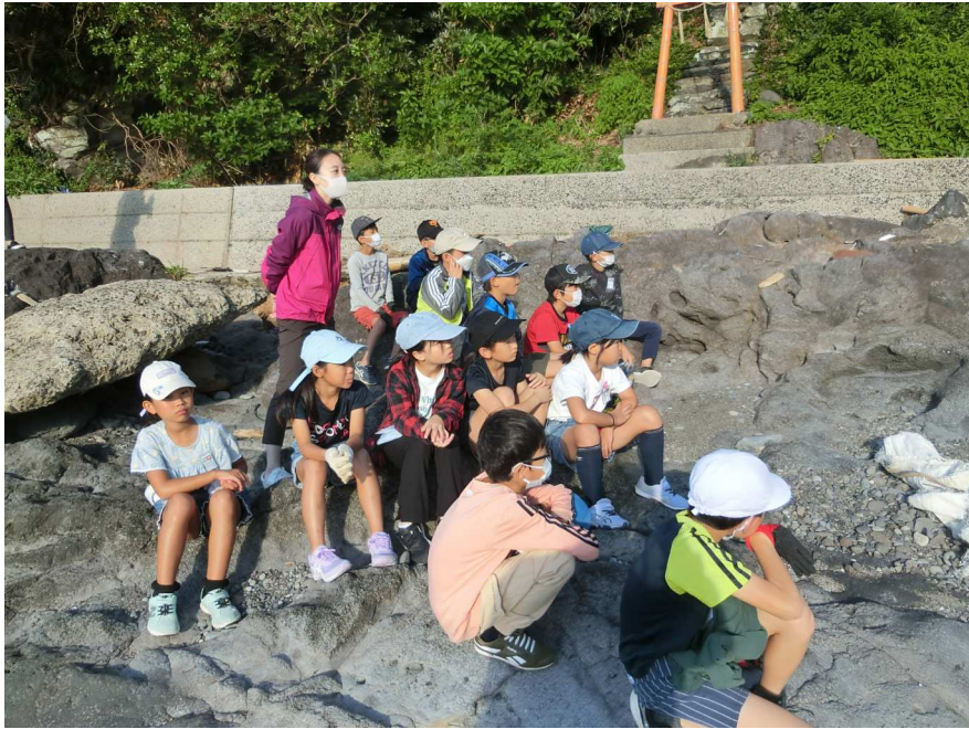
到着後、たくさんの海洋ゴミを眺める