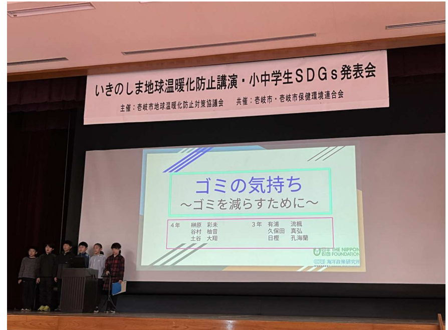
自分たちで作ったスライドで発表