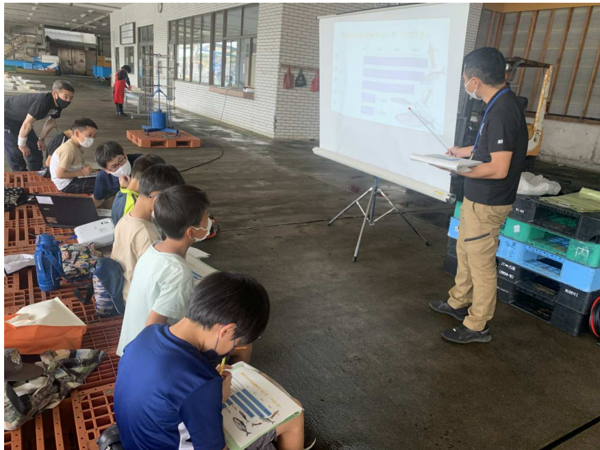
水産課職員さんのお話 (藻場)