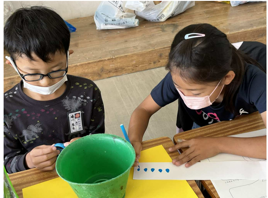
海洋ゴミに命を吹き込む②