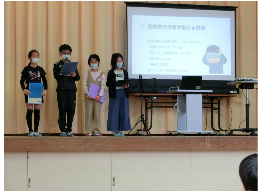
初山小学習発表会