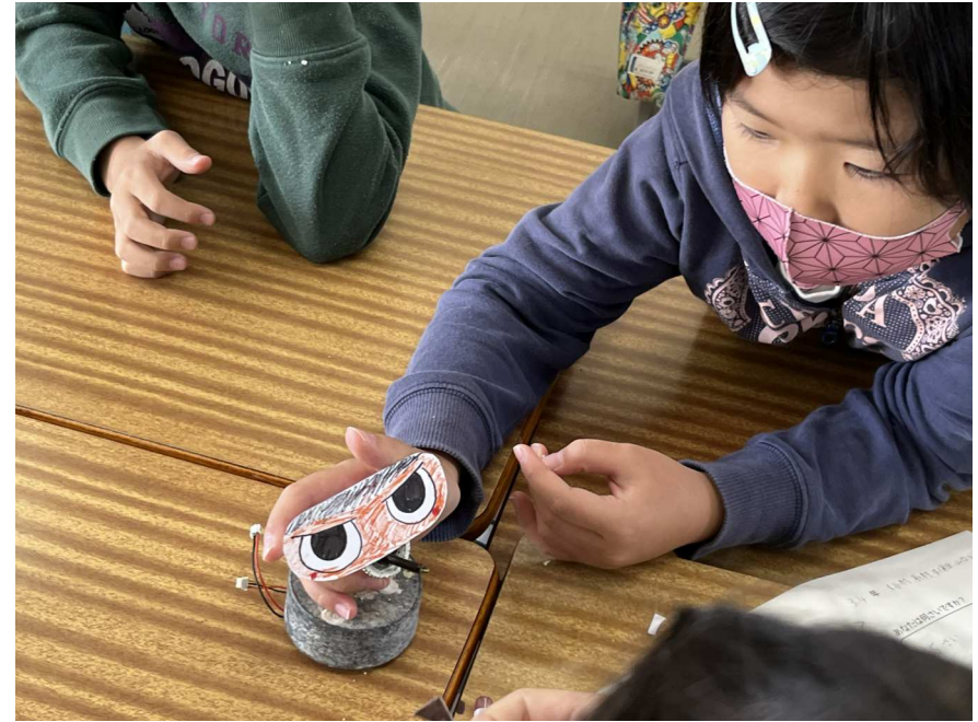
命を吹き込んだ海洋ゴミ