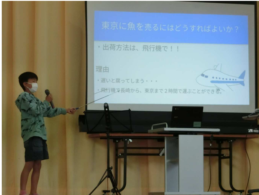
初山小学習発表会 (2)