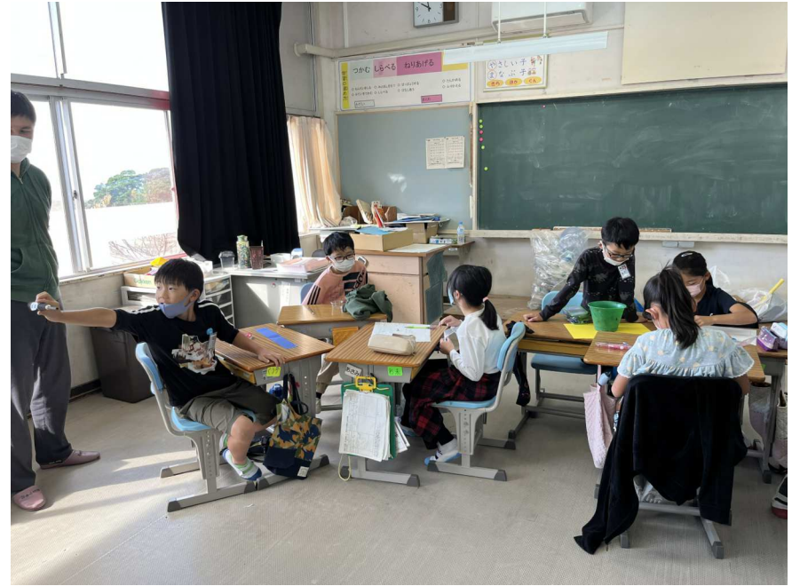
グループでインタビューシート作成