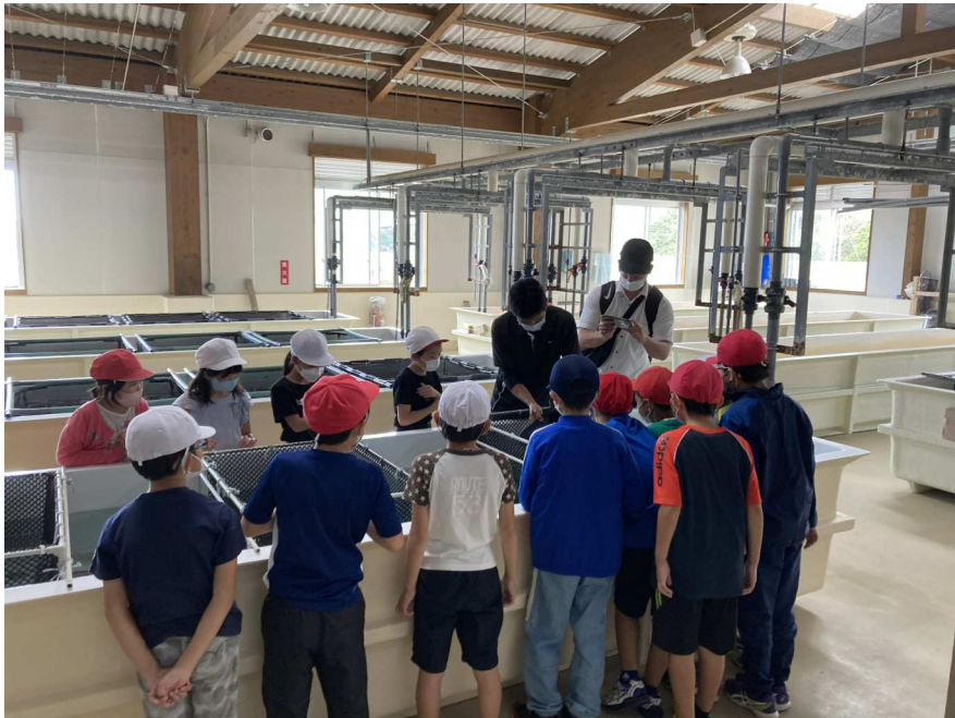
三島の養殖場で稚魚を見学