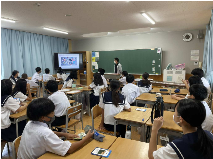
1(2)海洋ごみ問題についての講義視聴2