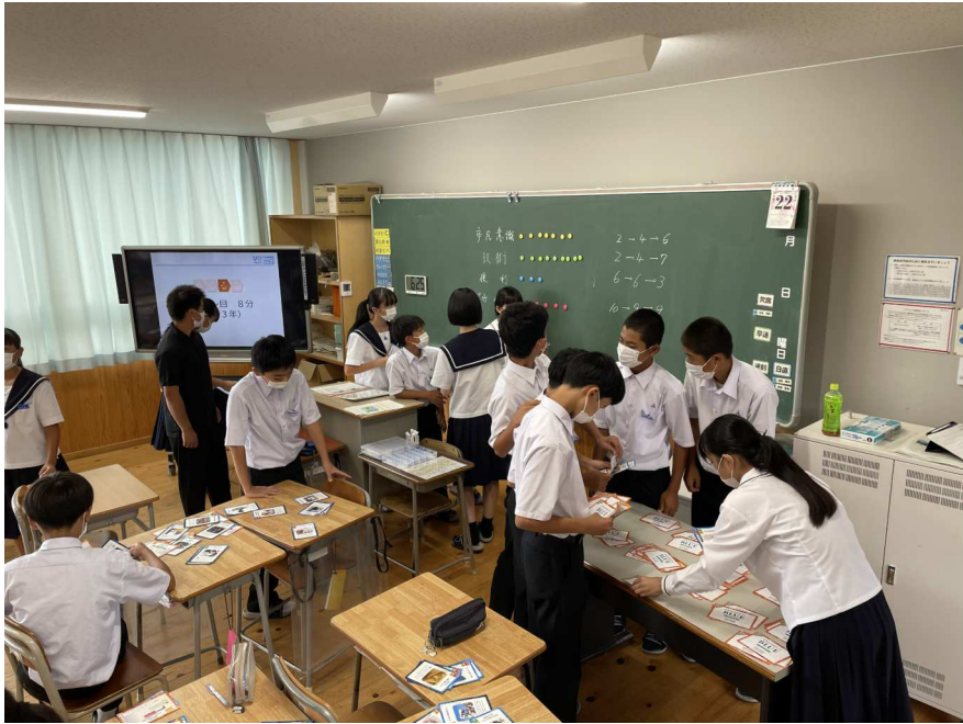
1(2)カードゲームの様子2