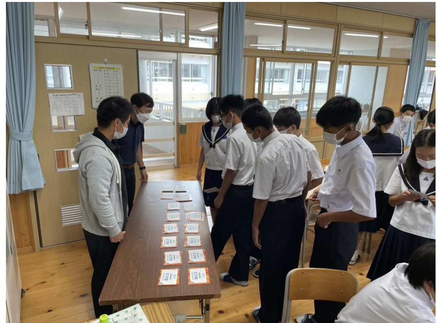
1(2)カードゲームの様子1