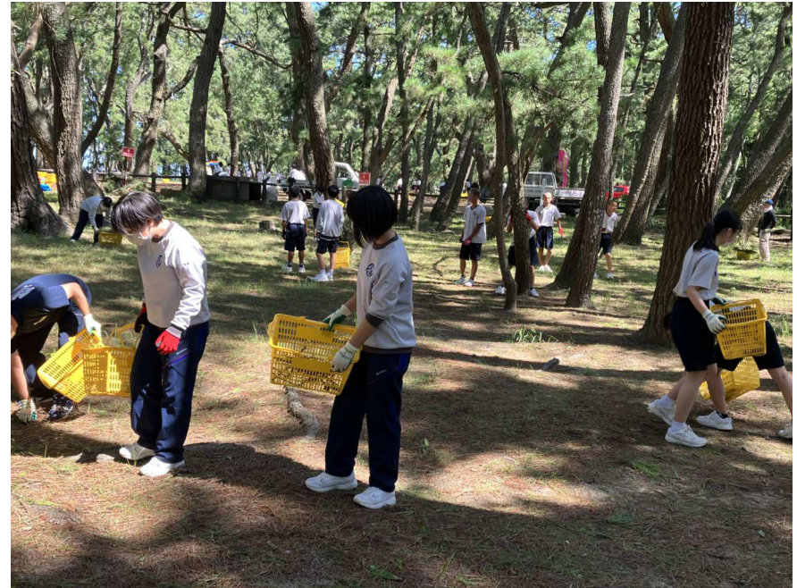
2(1)松原清掃活動の様子1