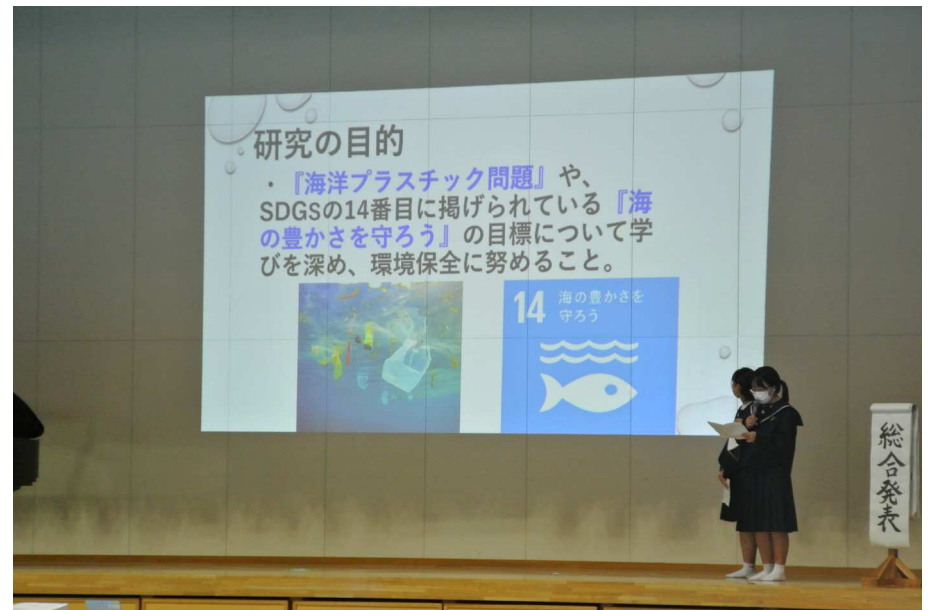
4(1)文化発表会での発表の様子1[1]