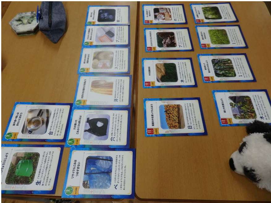
1(2)カードゲームChange For the Blue