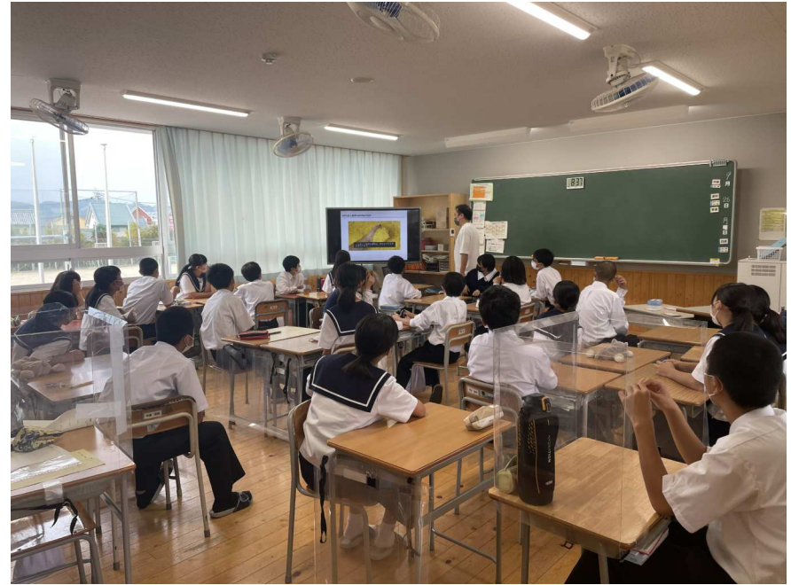
1(2)海洋ごみ問題についての講義視聴1