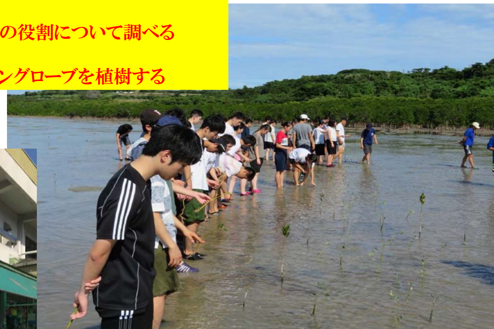
マングローブ植樹