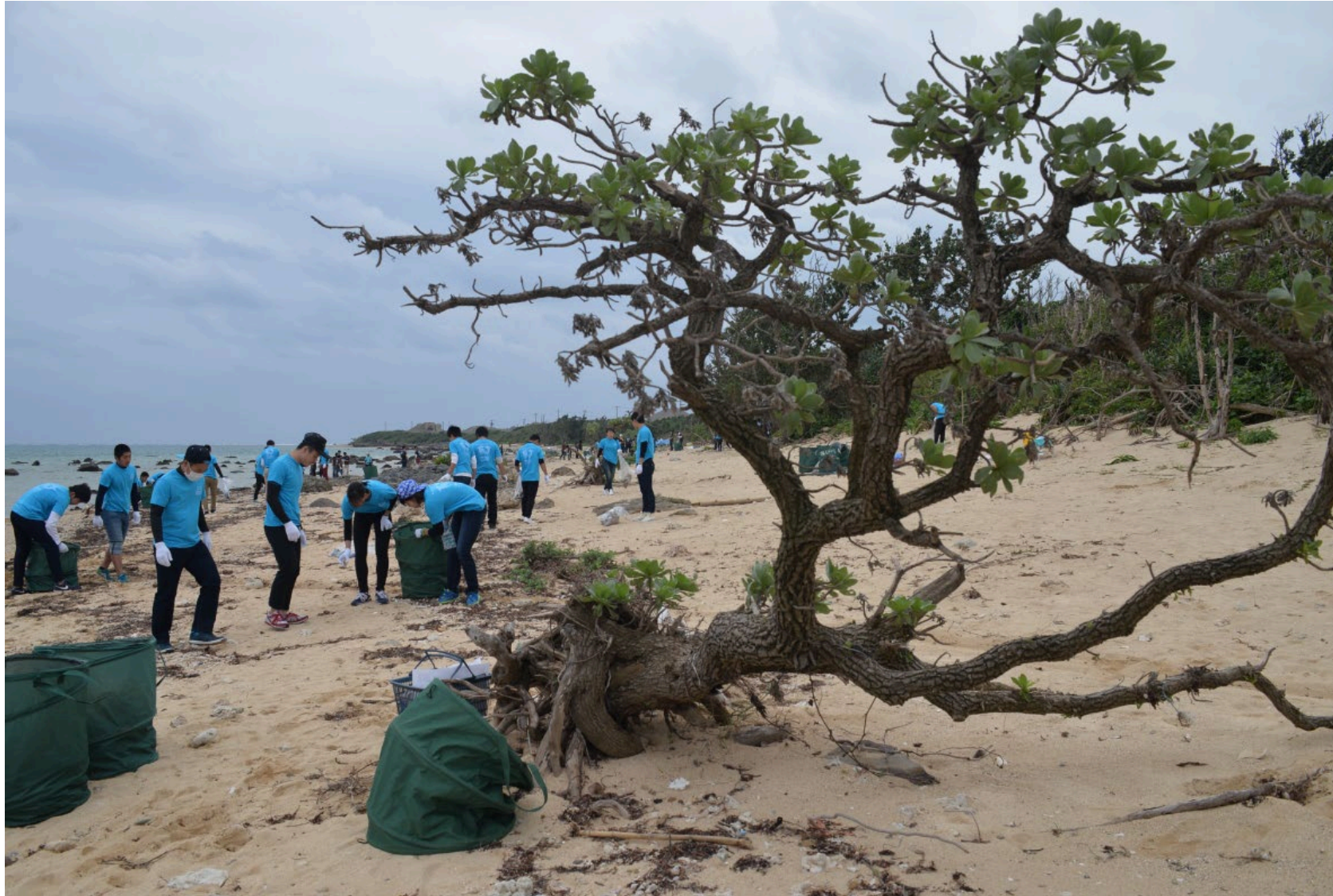
現地の方と一緒にBeach Clean2017