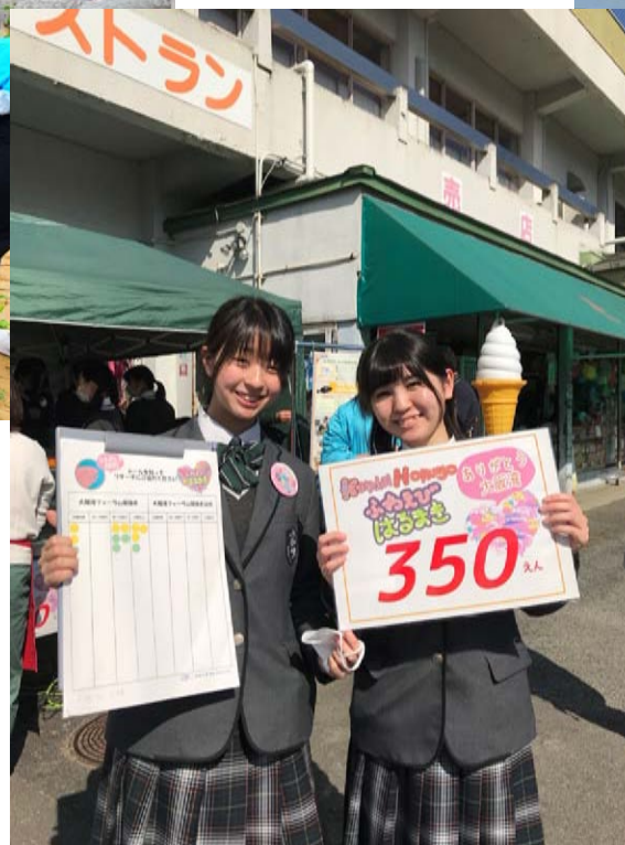
大阪湾の魚を使ったレシピ開発