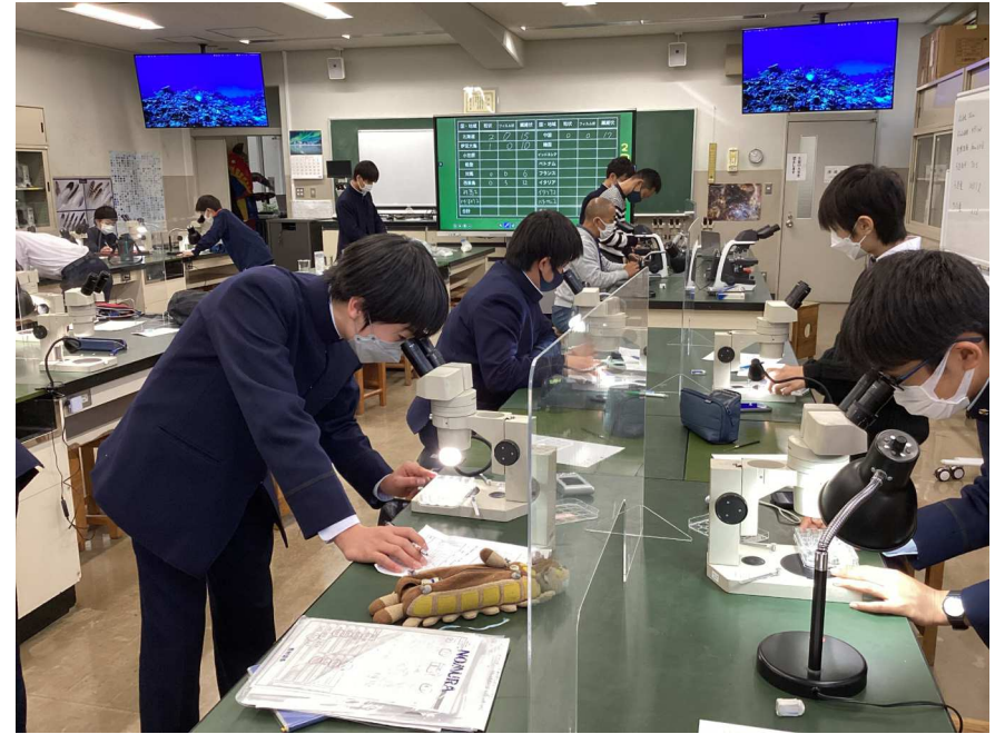
2. 実施概要_写真3_駒場東邦