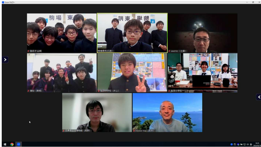
2. 実施概要_写真2_駒場東邦