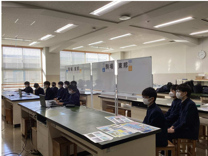
2. 実施概要_写真4_駒場東邦