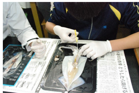
サポートを受けながら解剖実習をしているようす