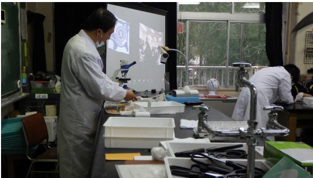
外部講師による解剖演示のようす