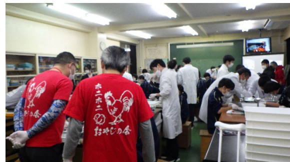
大学生、地域の方のサポートのようす