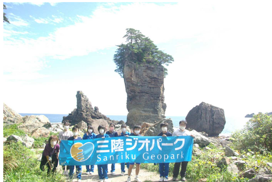
三陸ジオパークツアー