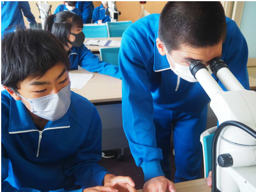
2年生宿泊研修 サケの学習