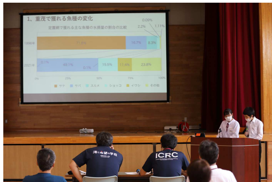
3年生「海の研究」第一次発表