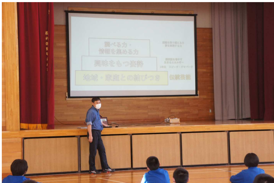
希望学オリエンテーション