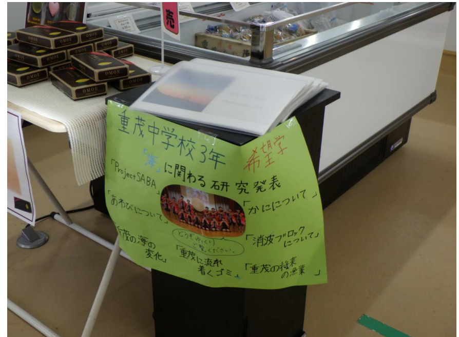
3年「海の研究」重茂水産体験交流館展示