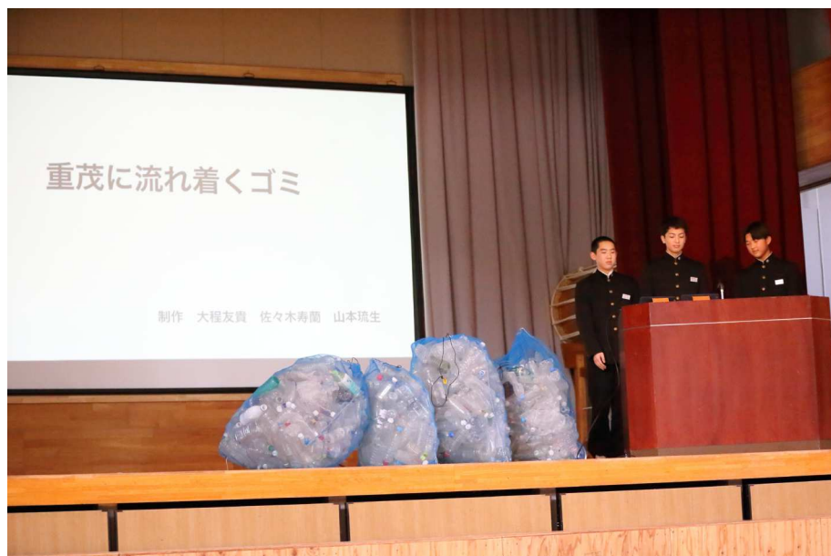
3年「海の研究」文化祭発表