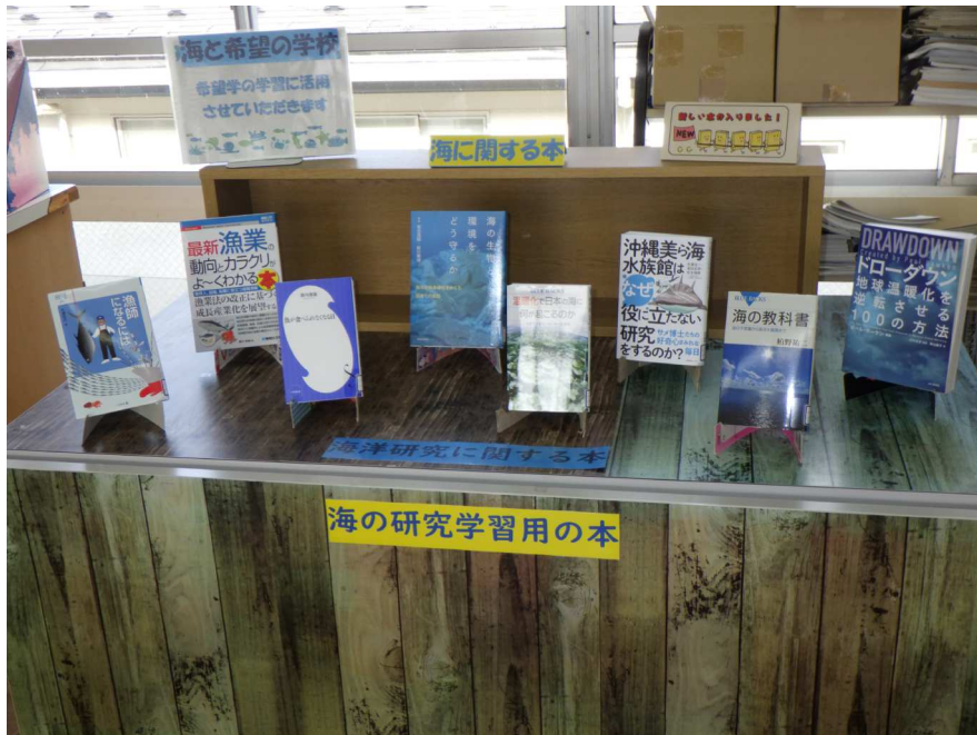
図書館 希望学「海の研究」コーナー