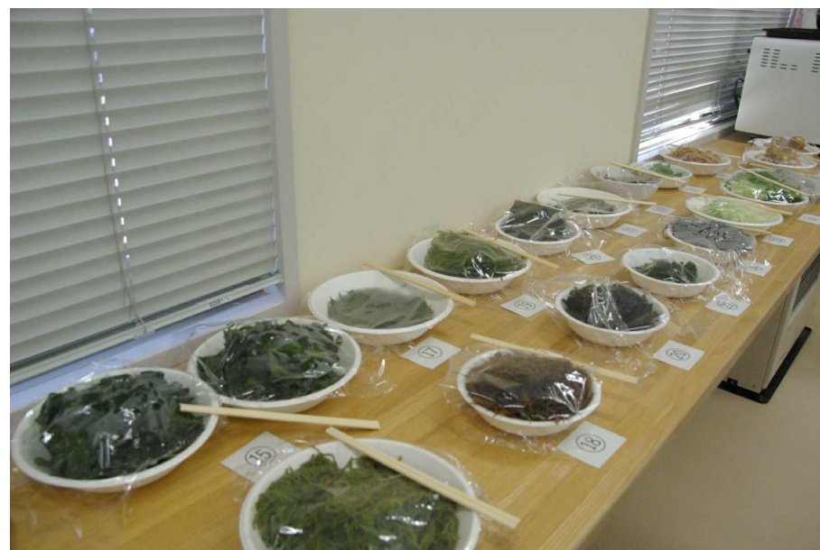
磯ラーメン講座 選択の具材