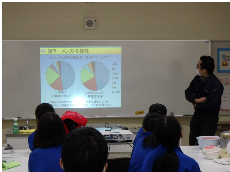
磯ラーメン講座 磯とは