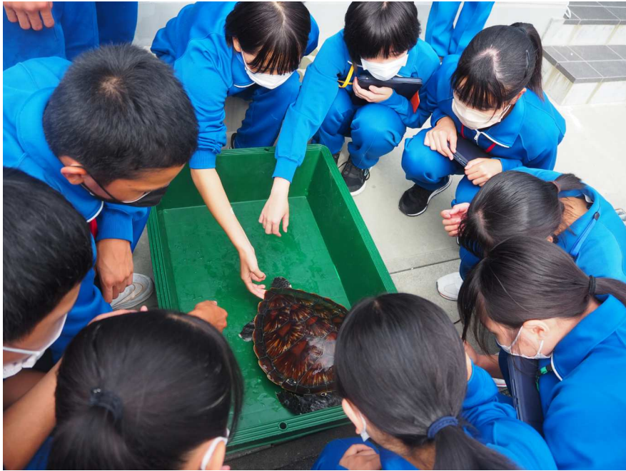
2年生宿泊研修カメの観察