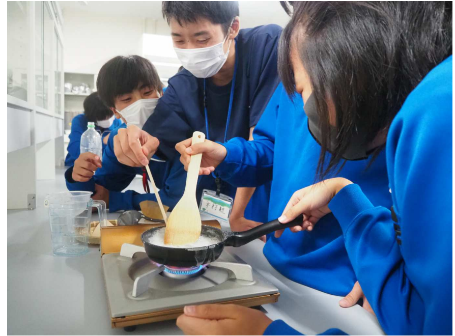
2年宿泊研修 塩の学習