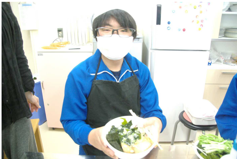
磯ラーメン講座 調理