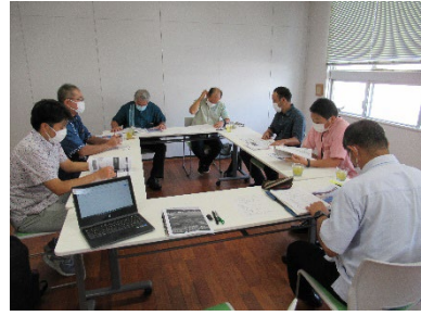
竹富町海洋教育週間特別企画「海のフォトコンテスト2021」審査会の様子