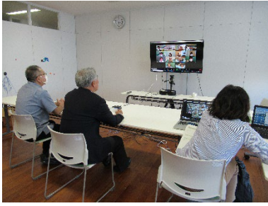
担当者協議会及び教育課程特例校会議の様子