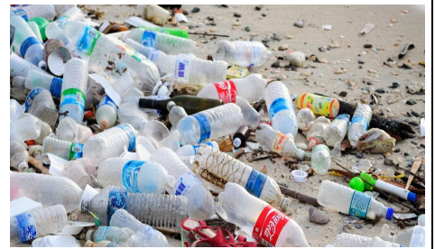
【プラスチックゴミ】