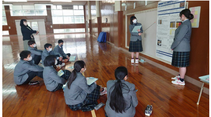
写真4 校内発表会（3/23）の様子