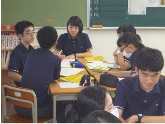
写真1 班別のミーティングの様子