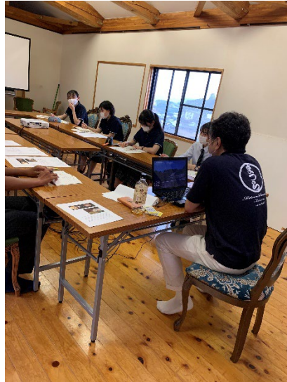
写真2 松浦史料博物館での館長へのインタビュー