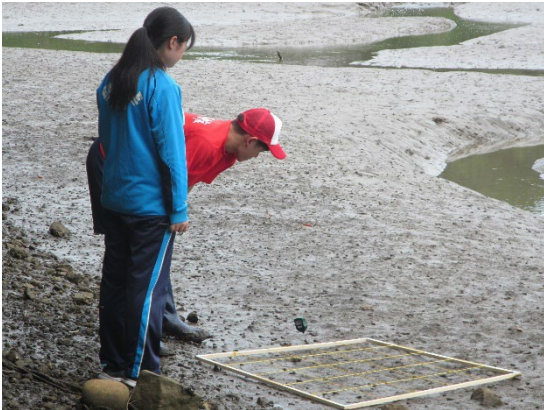
写真3 干潟調査（ドロアワモチ班）