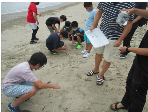
5・6年 マイクロプラスチック学習