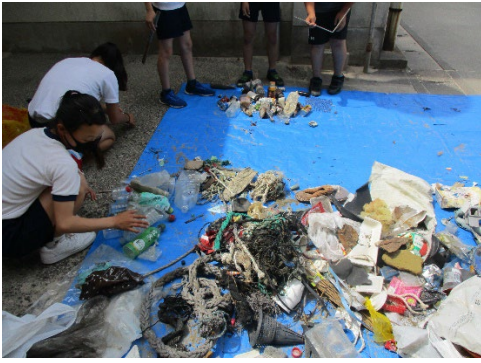
5年生 東の浜クリーン大作戦