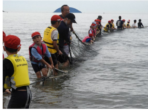
全校・地域で地引網