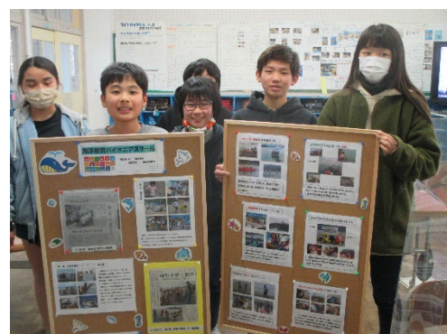
6年 海洋教育子どもサミット参加