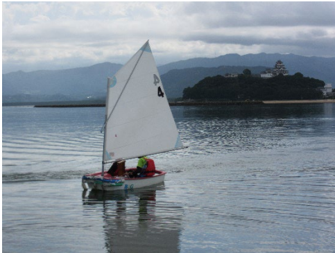
3・4年生 ヨット・カヌー体験