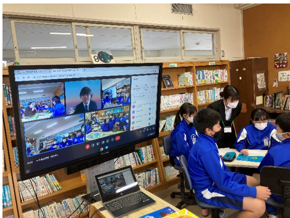
岩手大学学生とのリモート討議