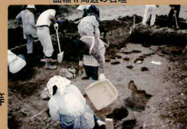
平成5年度の発掘調査風景（十五夜踊り保存館周辺）

また、現在の土俵前の調査区では、城跡の当時の床面と思われる層が確認されました。出土品は、11世紀から近現代まで幅広い年代のものがあありますが、14世紀～15世紀頃の陶磁器が多く出土しています。