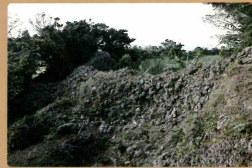
崖の平坦面を塞ぐ石垣1

与論城跡（与論グスク）は、鹿児島県最南端の島である与論島にあります。城跡は、島の南側に位置する城集落の西端の台地の端を利用して築かれています。伝承や江戸時代の古文書では、琉球国北山王の三男王舅や琉球王国の尚真王代の人物とされる花城真三郎によって築かれたといわれています。