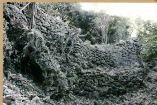
崖を塞ぐように築かれた石垣2

与論城跡の特徴はその大きさだけではありません。崖を利用した城造りにあります。与論島は石灰岩に覆われた低い島ですが、与論城跡のある場所は、断層によってできた高さ60m近い崖や巨岩が露出しています。この崖は、天然の城壁になるだけでなく、城の石垣の材料にもなります。この崖と巨岩の間を塞ぐように石垣をめぐらすことで、高い防御性を有しています。また、崖下には水が湧く場所もあるため、水源の確保も可能です。このように与論城跡は島の地形を十分に理解した上で、とても巧みに利用して築城されています。