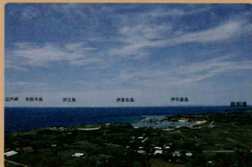
与論城跡からの眺め（伊平屋島方面）

与論城跡の主郭に立つと考えられる琴平神社からは、周辺の島々や与論島の主な港や入り江（茶花港、供利港、ハキビナ海岸）を望むことができます。船による交易が重要な役割を果たしていた時代には、この城の存在は、海上交通を抑えるうえで重要な役割を果たしていたと考えられます。