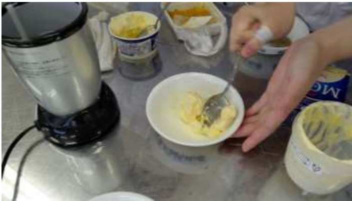
ウニソフトクリームの試作