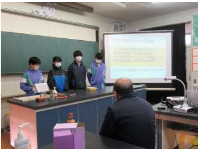
道の駅の駅長さんに提案（プレゼン）