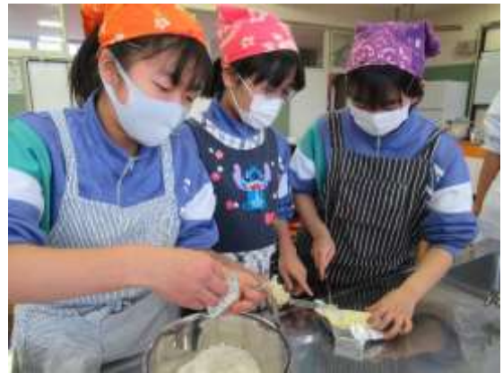
ワカメを使った菓子（スコーン）の試作