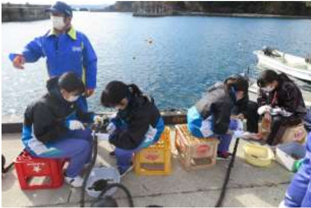
ワカメ養殖の体験