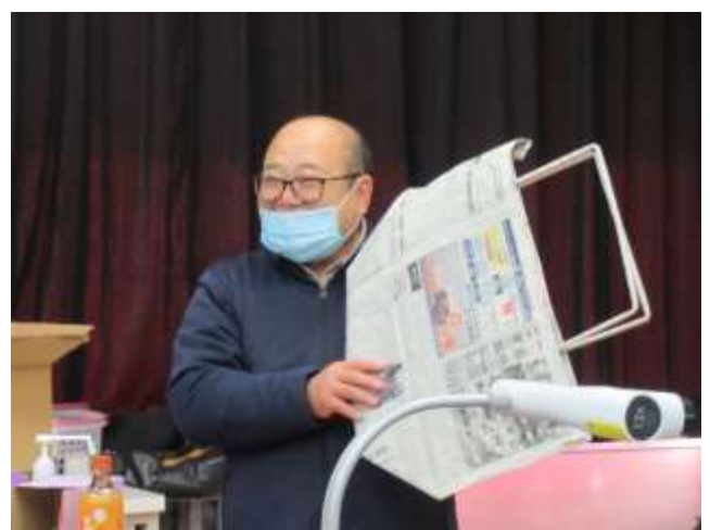
道の駅の駅長さんに新聞紙エコバックを提案