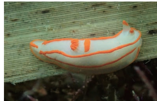
キンセンウミウシ