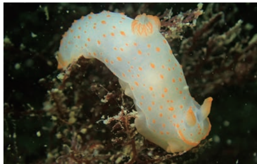
アカボシウミウシ

えほん なか くん た み 絵本の中でアオウミウシ君はアカボシウミウシとキンセンウミウシを食べているところを見ていましたね。ウミ ウシが他のウミウシを食べることをウミウシのとも ぐ い 共食いと言います。しかしとも ぐ いちぶ 共食いをするウミウシは一部で、ア オウミウシはカイメンなどのどうぶつ た 動物を食べます。