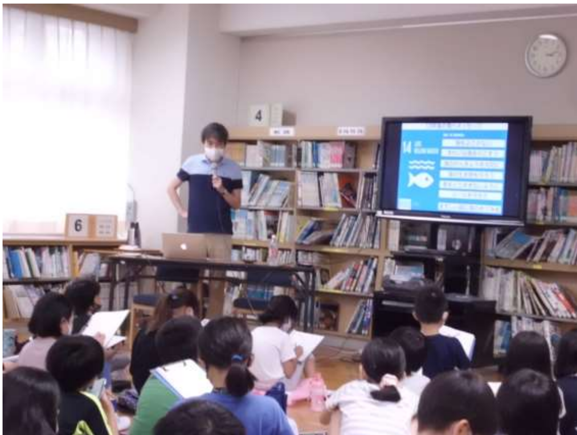
〈玉川上水について知ろう〉写真③ - 1