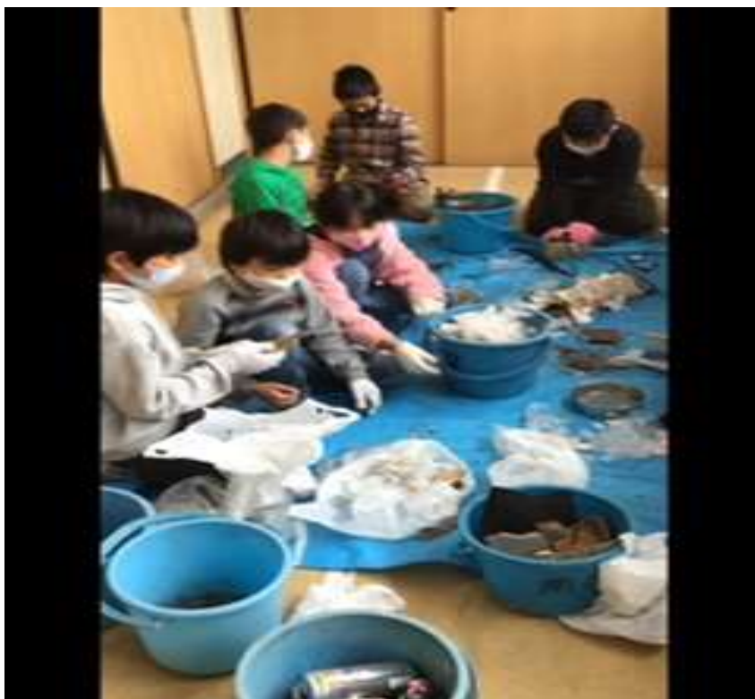
〈ゴミ拾いの活動〉 写真⑨ - 4