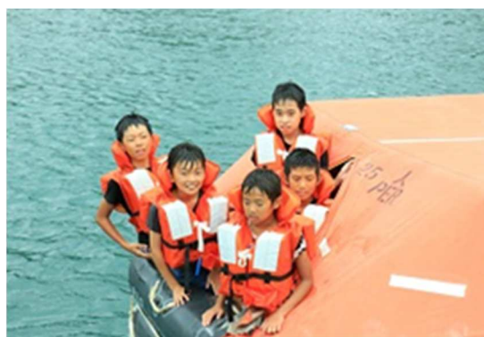
写真 4：救命いかだ体験