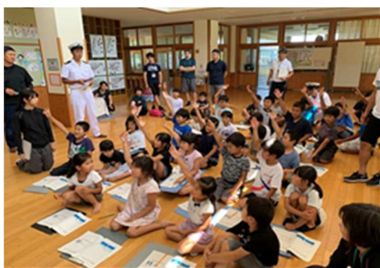
写真 1：座学学習の様子

・水難事故防止を目的とし、島内で生活する児童たちが、海辺での事故に巻き込まれた際にも対応できる「知識」と「スキル」を身につけることをテーマに「海辺の安全教室」と題した海洋教育プログラムを大崎上島町立木江小学校の児童に対して実施した。