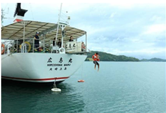
写真 3：船からの脱出訓練

・大崎上島に暮らす人々は、船が身近な交通機関であり、本土へ渡る際には船を利用するしかなく、島内にて生活する児童たちは日常的に船に乗る機会がある。そこで万が一船舶事故に巻き込まれた際に、慌てず対応できる基本的な訓練を体験するプログラムを考案し、小学生を対象としたプログラムを実施した。