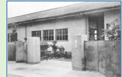
昭和 30 年代の正門

昭和42年 7月 9日(日) 呉地方をおそった梅雨の集中豪雨のため、水害により本校生徒4名死亡。津久茂20名,長浜9名,小坪2名死亡。