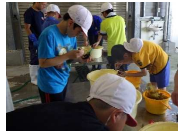
6年 洋野の海は世界とつながっている～修学旅行での被災地見学（学校行事）