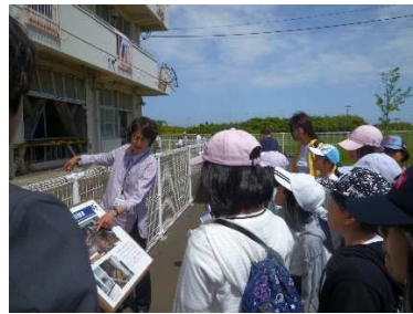
6年 洋野の海は世界とつながっている～海洋教育こどもサミット（総合的な学習の時間）