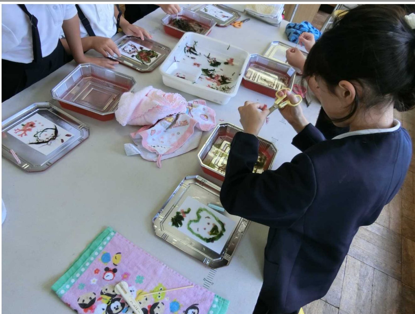
写真データをここに貼り付けてください