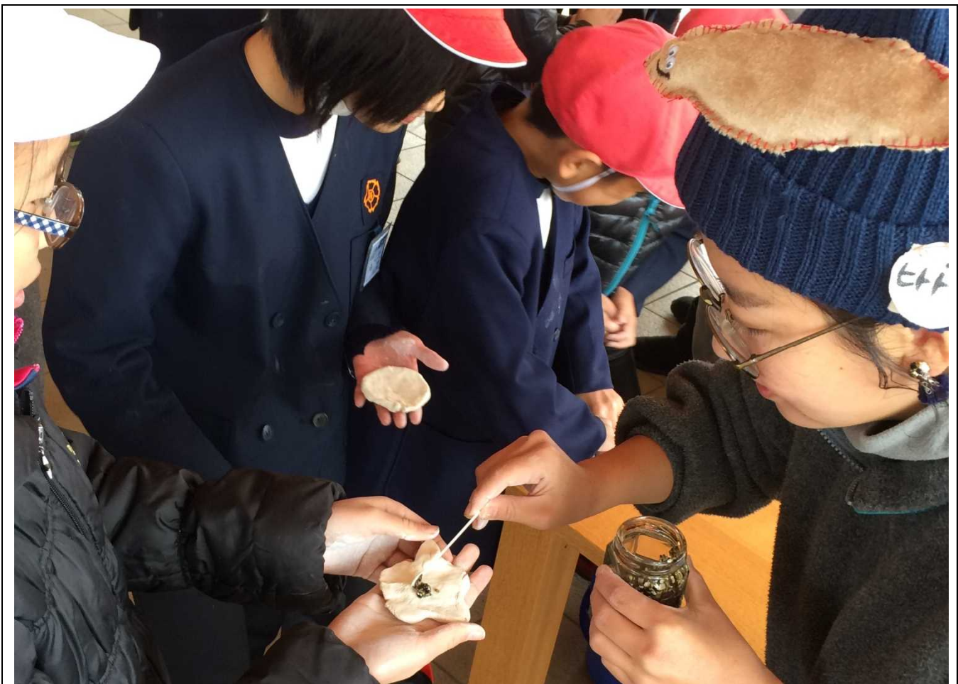
写真データをここに貼り付けてください