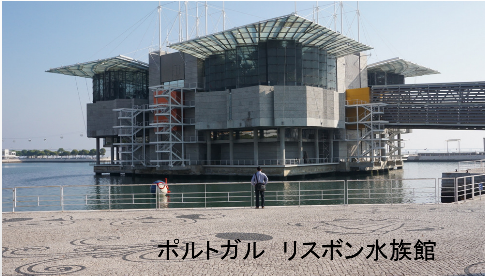
ポルトガル リスボン水族館