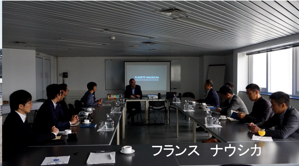
フランス ナウシカ