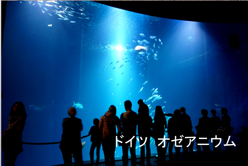
ドイツ オゼアニウム