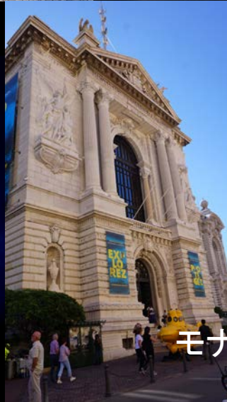
モナコ モナコ水族館