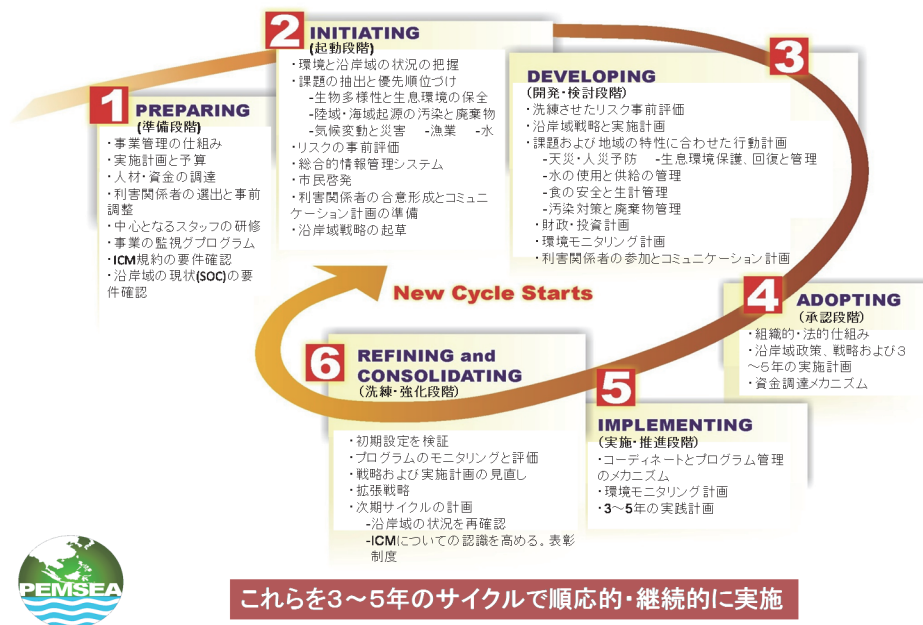
ICM サイクル図 (ICMの導入、促進での順応的管理の実績より)

東アジア海洋環境管理パートナーシップ (PEMSEA) で提唱されている沿岸域総合管理の実施サイクルの例