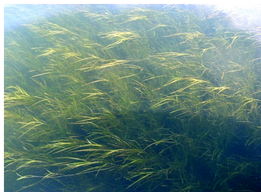
（左：進む日生大橋（仮称）の架橋作業、右：繁茂するアマモ）