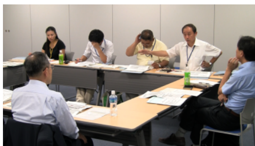
当財団と里海推進室メンバーとの議論の様子 (共同研究会開催状況)

市においては、里海推進室が中心となって、「志摩市里海創生基本計画」（志摩市沿岸域総合管理計画）の策定に取り組んでいる。