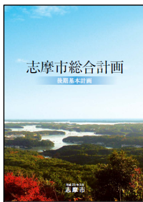
志摩市総合計画表紙 (志摩市 HP より)

平成23年4月には、新しい里海創生に向けた取組体制の強化を図るため、農林水産部内に「里海推進室」を設置した。同室が、沿岸域総合管理の取り組みを推進するための部局横断的な組織として位置づけられる（平成22年度までは、産業振興部水産課及び生活環境部環境課が里海創生プロジェクトを担当していた。）。里海推進室は室長（部長級）以下、担当者3名の合計4名により構成されている。