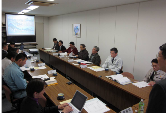
第1回小浜湾海の健康診断評価委員会での検討状況