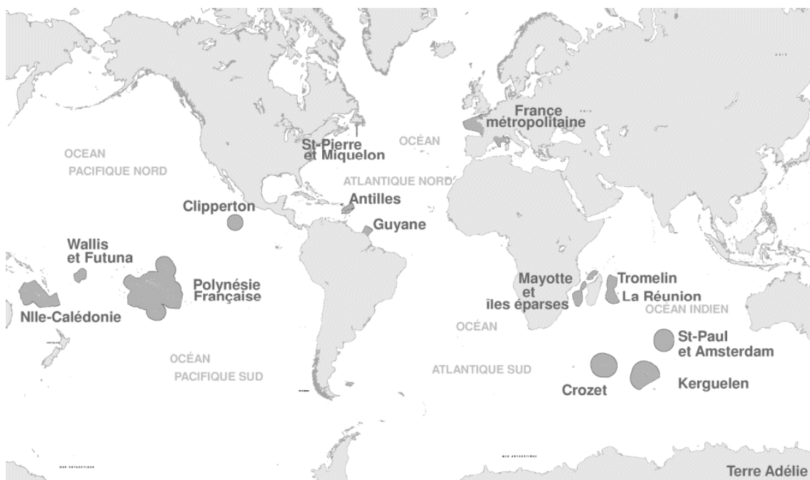
フランスの管轄下にある海域

COMOP12「海洋および沿岸域の総合的管理」の任務は、環境グルネル会議の決定事項に由来するものが主であったが、国内レベル、EU レベル、国際レベルのあらゆる背景に留意するため、その考察の領域を広げざるを得なかった。それゆえ、COMOP 12 の提案は、グルネル会議で提起された、しばしばきわめて限定された領域の問題に比してスケールが大きく、かつ、そうした問題よりもずっと川上に位置する問題を扱っているように思われるかもしれない。このような限定的な問題から出発して、なぜ海洋・沿岸域政策の新しいアプローチを提案する必要性が生じたのかを本報告書に示す。