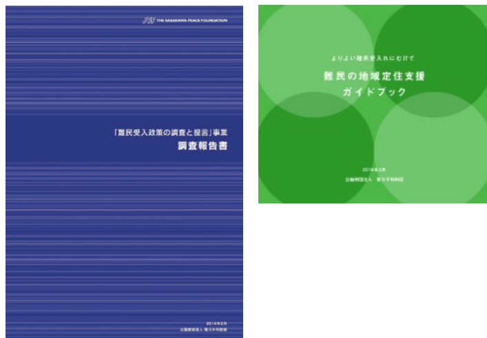
〈図表0-1〉 笹川平和財団の国際人口移動分野の取り組み

国籍に関わらず私たちが暮らす地域社会は、異なる文化的な背景を持つ人々に対していかに向かい合い、どのように共生を進めていけるのでしょうか。同じ地域に生きる住民として接し、つながるために、何が求められているのでしょうか。これは、今日の日本が直面している重要な問いであり、将来長きにわたり優先的に取り組まれるべき課題です。