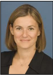
シャロン・スクアソーニ 米国戦略国際問題研究所(CSIS)/核不拡散プログラム・ディレクター

原子力業界の管理職に 25 年間勤務。バブコック・アンド・ウィルコックス社原子力エネルギー部の副社長を務める。バブコック・アンド・ウィルコックス原子力エネルギー社、バブコック・アンド・ウィルコックス原子力発電グループ社にて「ビジネス開発及び戦略的同盟室」副社長、「原子力生産ライン」部長を歴任。