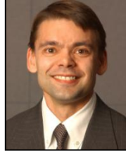
チャールズ・ファークソン 日米原子力ワーキンググループ共同議長/アメリカ科学者連盟会長

2010年1月1日よりアメリカ科学者連盟会長を務める。10年前はシニア・リサーチ・アナリスト及び原子力政策プロジェクトのディレクターとして核拡散と軍備管理問題に携わる。外交問題評議会(CFR)では、ウィリアム・J・ベリー氏とブレント・スコウクロフト氏が議長を務める「米国核兵器政策に関するタスクフォース」のプロジェクト・ディレクターを務めた。加えて、軍備管理、気候変動、エネルギー政策、核及び放射線テロリズムを専門とし、ジョージタウン大学安全保障プログラムで准教授を務める。