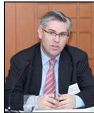
L・ゴードン・フレイク モーリーン・アンド・マイク・マンズフィールド財団 所長

2010年1月1日よりアメリカ科学者連盟会長を務める。10年前はシニア・リサーチ・アナリスト及び原子力政策プロジェクトのディレクターとして核拡散と軍備管理問題に携わる。外交問題評議会(CFR)では、ウィリアム・J・ベリー氏とブレント・スコウクロフト氏が議長を務める「米国核兵器政策に関するタスクフォース」のプロジェクト・ディレクターを務めた。加えて、軍備管理、気候変動、エネルギー政策、核及び放射線テロリズムを専門とし、ジョージタウン大学安全保障プログラムで准教授を務める。