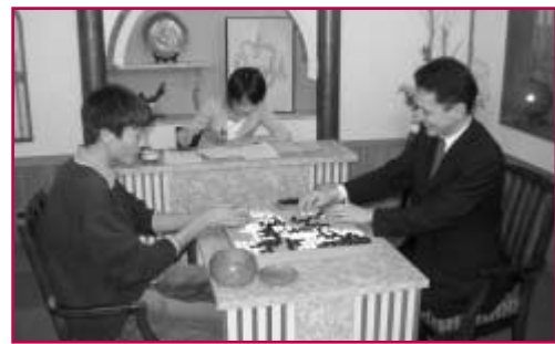
CS放送『囲碁・将棋チャンネル』での収録：2004年2月放映予定

収録を見学に来た他の二人も、途中から碁盤を持ち出し、モニターを見ながら、実際に打ち始め、研究に余念がない。