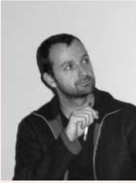
フレデリック・フィスパック氏

ヨーロッパ舞台芸術の今を代表する2人のアーティストを招いての催しである。自らの軌跡を重ねながら展開する舞台芸術論としての『現代舞台芸術のいくつかの美学的傾向』